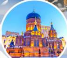
จัตุรัสโบสถ์เซ็นต์โซเฟีย