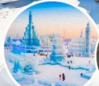
เทศกาลน้ำแข็งฮาร์บิน