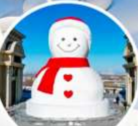
ตุ๊กตามนุษย์หิมะยักษ์