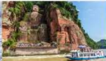
ล่องเรือชมหลวงพ่อดเล่อซาน