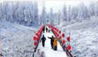
ภูเขาหิมะวาจู่