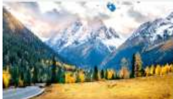
ภูเขาสี่ดรุณี (หุบเขาชวงเจียวโกว)