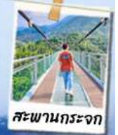
สะพานกระเจ๊ก