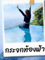
กระเจ๊กท้องฟ้า