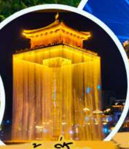
อุณหภูมิลดลง