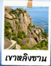
เวาหลิงชาน