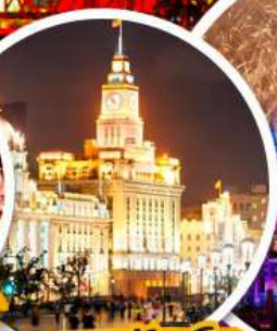
เดอะบันด์