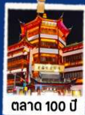
ตลาด 100 ปี