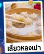
เสี่ยวหลงเปา