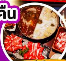
บุฟเฟ่ต์ชาบู