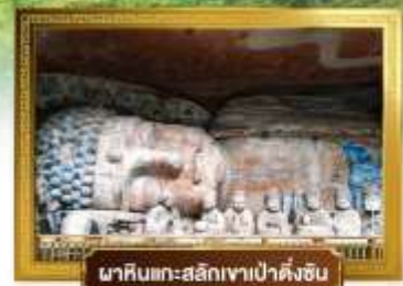
นาหินแกะสลักเจาเป่าต้งซัน

เดินทางโดยสายการบินเฉิงตูแอร์ไลน์ อาหาร : 14 มื้อ โรงแรม : 4 ดาว