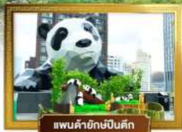
แพนด้ายักษ์ปิ่นตึก