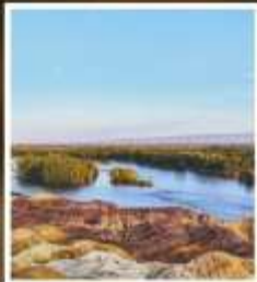
ธารน้ำ 5 สี