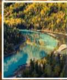
ทะเลสาบมังกรหลับ