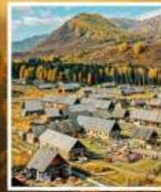
หมู่บ้านเหอມู่ซุน