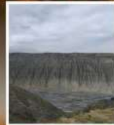
แกรนด์แคนยอนตู่ชานจื่อ