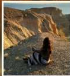
เขตปิศาจทะเล