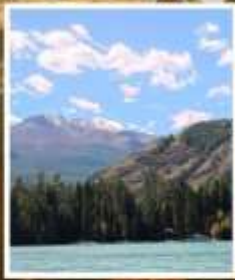
ล่องเรือทะเลสาบคานาสือ

รับฟรี!! ประกันสุขภาพ และ อุบัติเหตุ 2 ล้านบาท